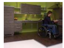
Foto links: Restaurant Centraal Bureau in Gouda